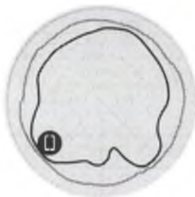
Figure 2 - T310d 2.4GHz Azimuth Antenna Patterns