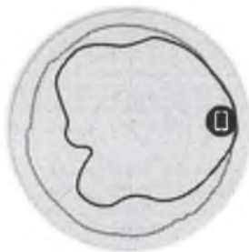
Figure 3 - T310d 5GHz Azimuth Antenna Patterns