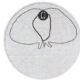
Figure 4 - T310d 2.4GHz Elevation Antenna Patterns